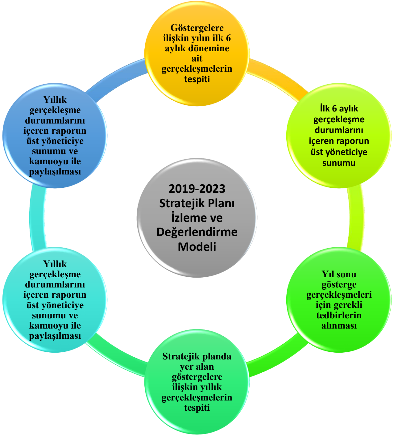
Şekil 2: İzleme ve Değerlendirme Modeli